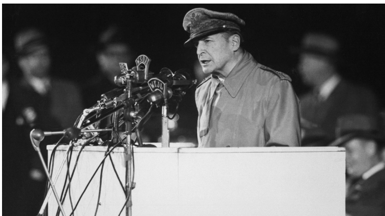
Generalul Douglas MacArthur vorbind mulțimii pe Soldier Field, în Chicago, în timpul turneului de adio din 1951, după destituirea sa de către Truman și de către șefii Statului-Major, din cauza ultimatumului dat Chinei.

Episodul dramatic al concedierii lui MacArthur de către Truman pentru insubordonare și șocul provocat de eşecul puternicei